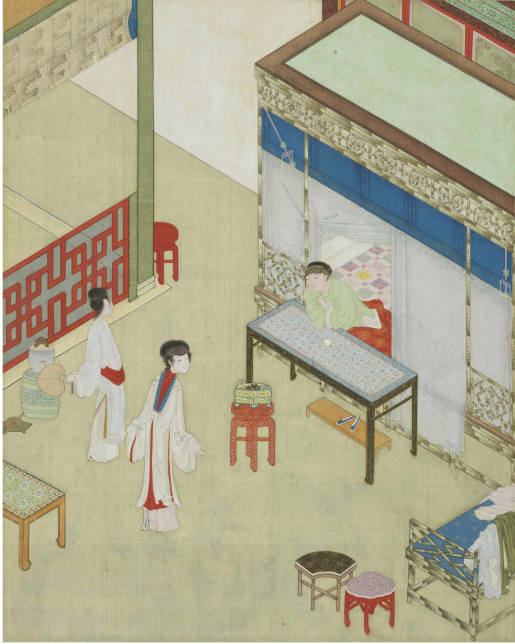
图六 花子虚因气丧身