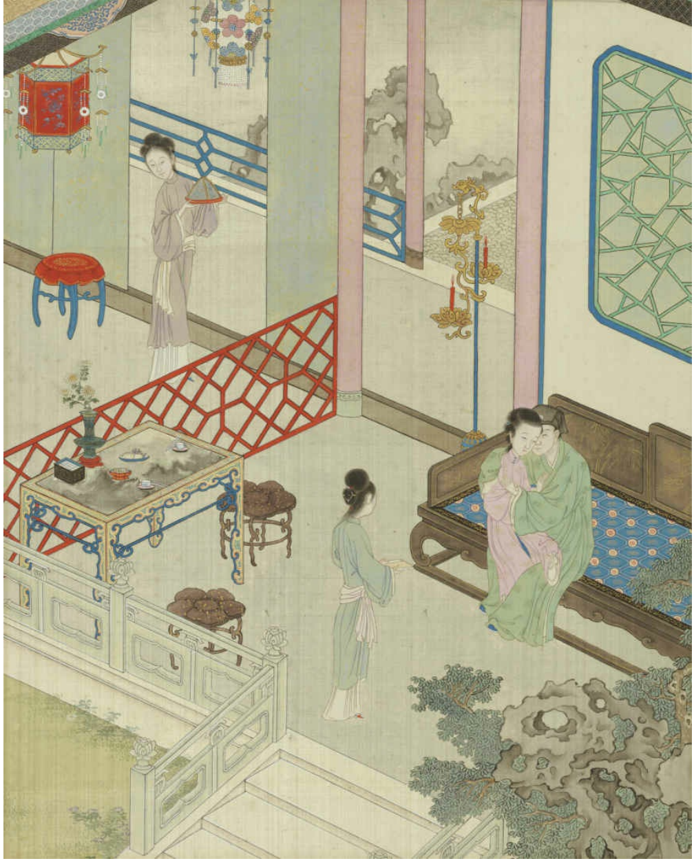
图八 西门庆择吉佳期