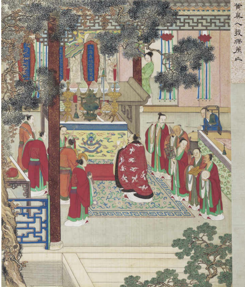
图二十 黄真人发牒荐亡