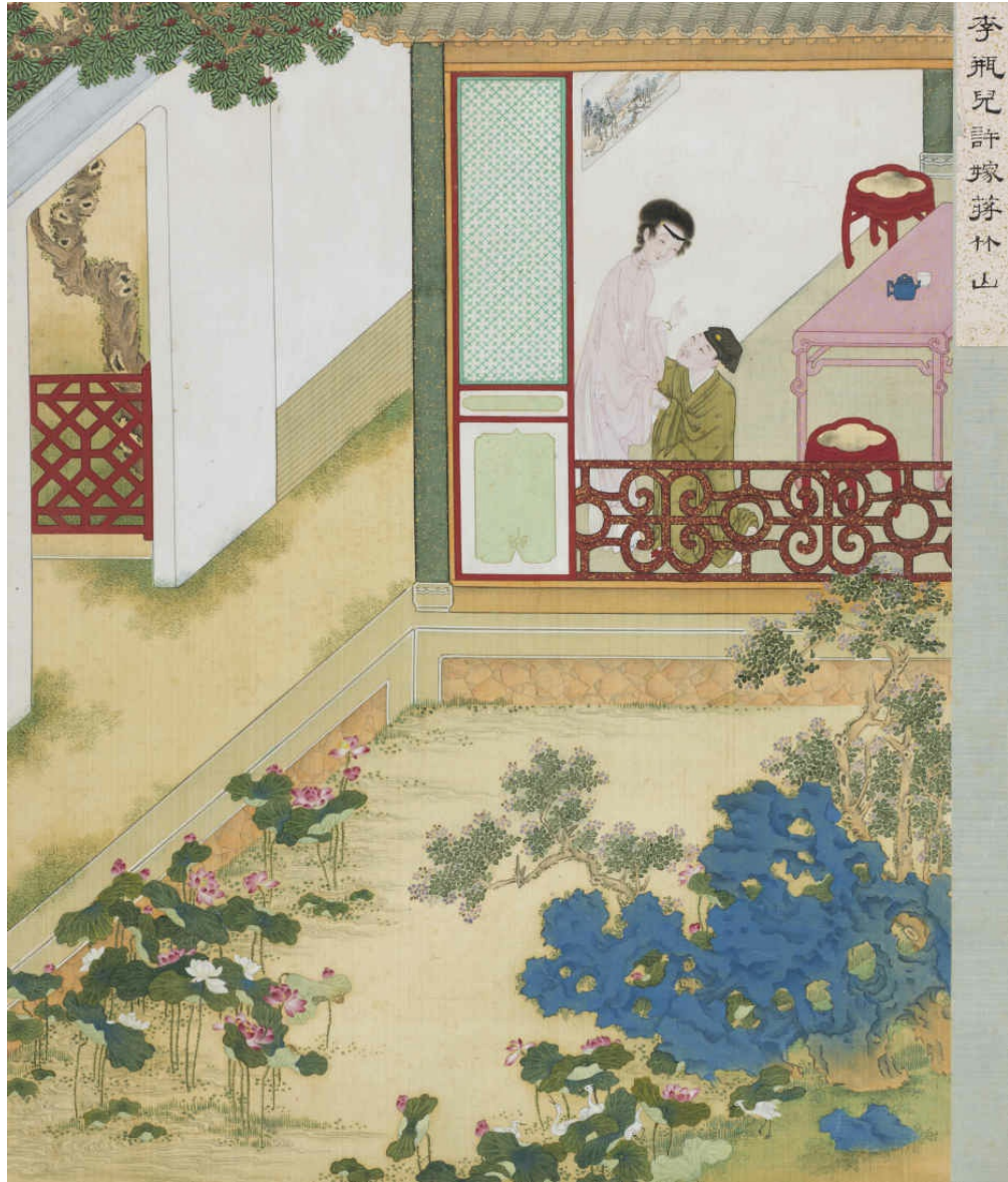
图十 李瓶儿许嫁蒋竹山