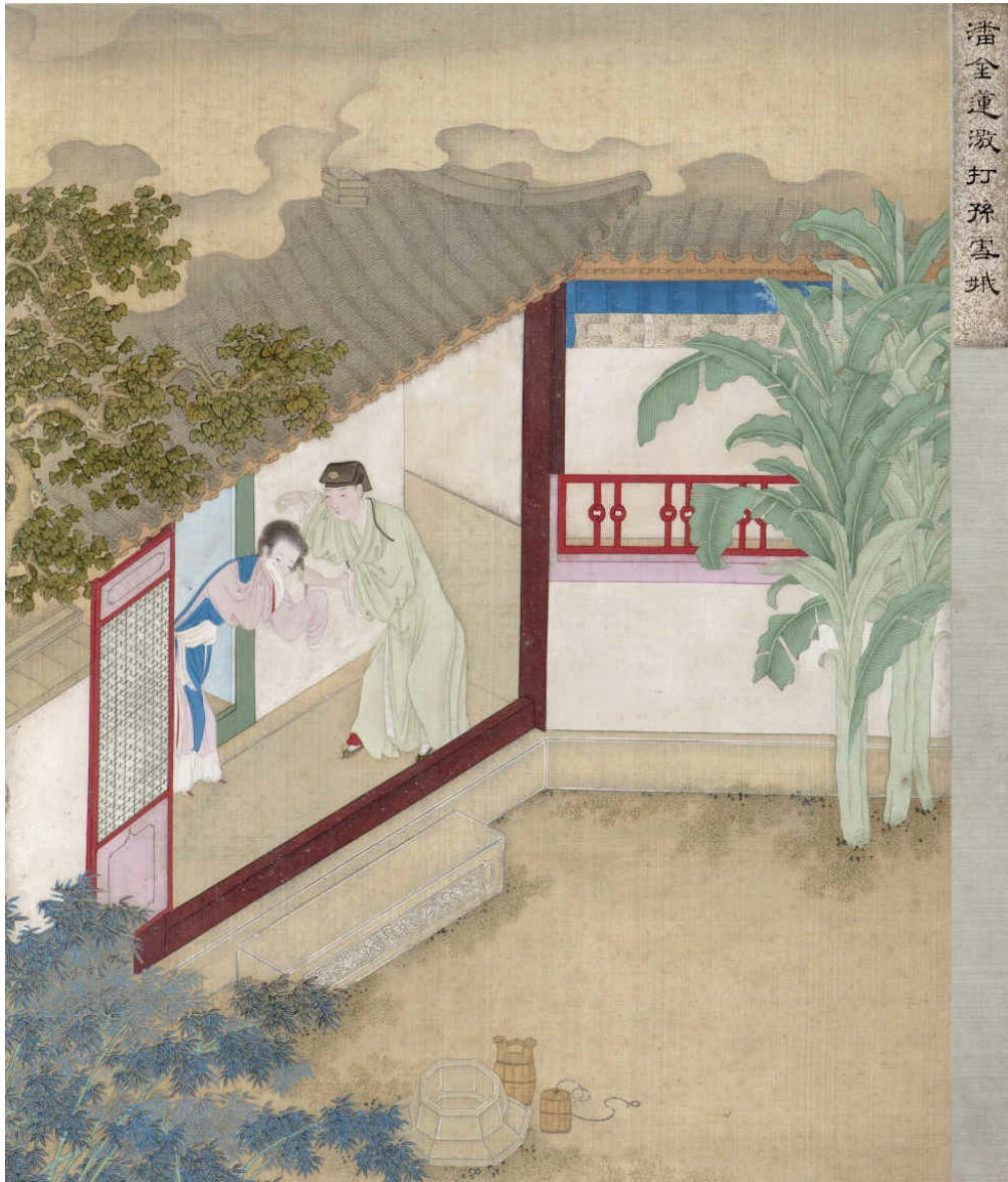
图一 潘金莲激打孙雪娥