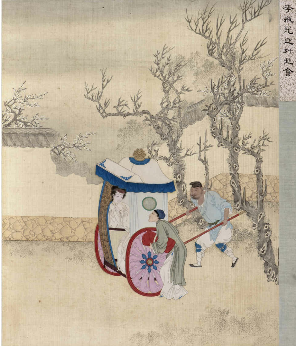
图七 李瓶儿迎奸赴会