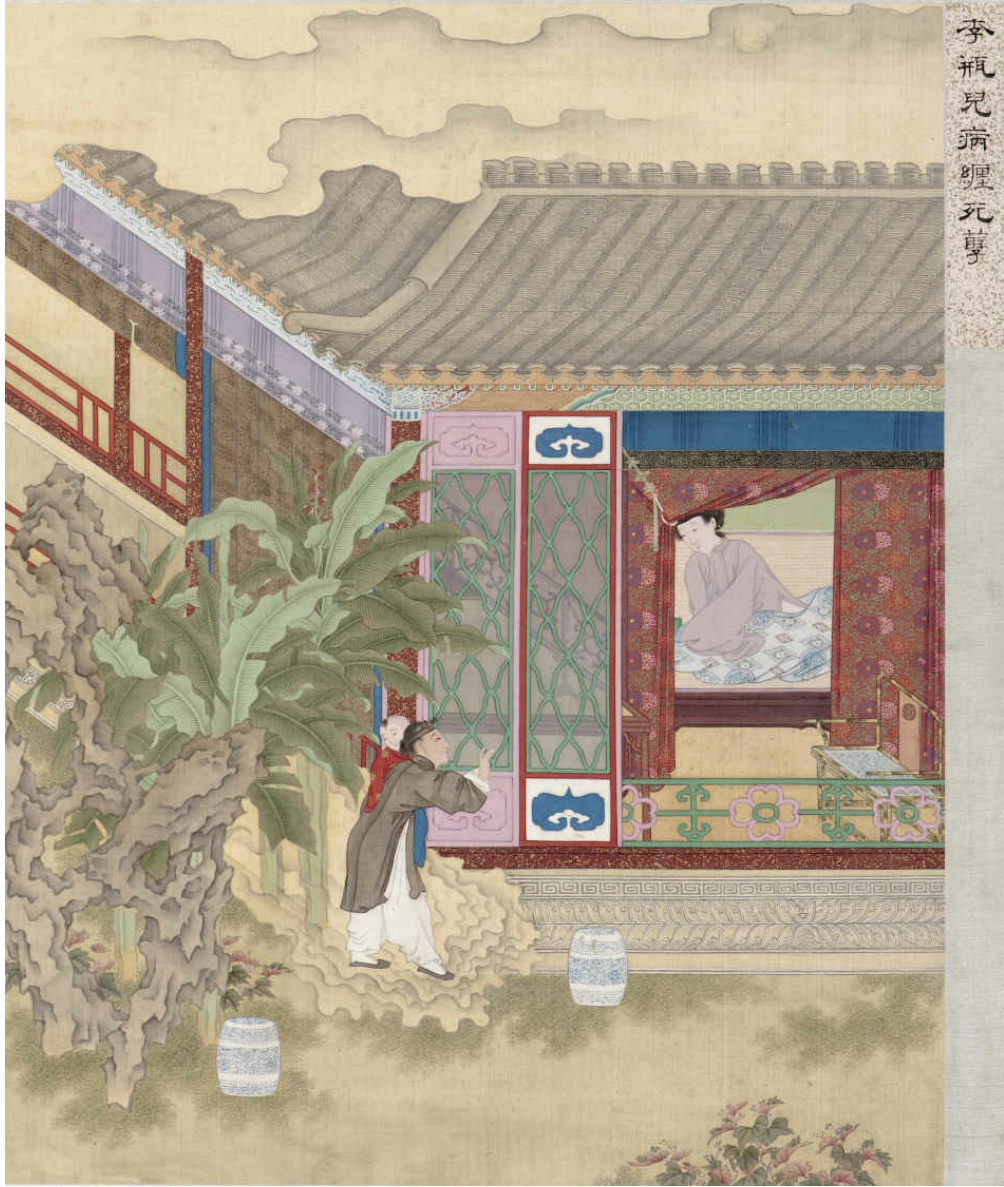
图十六 李瓶儿病缠死孽