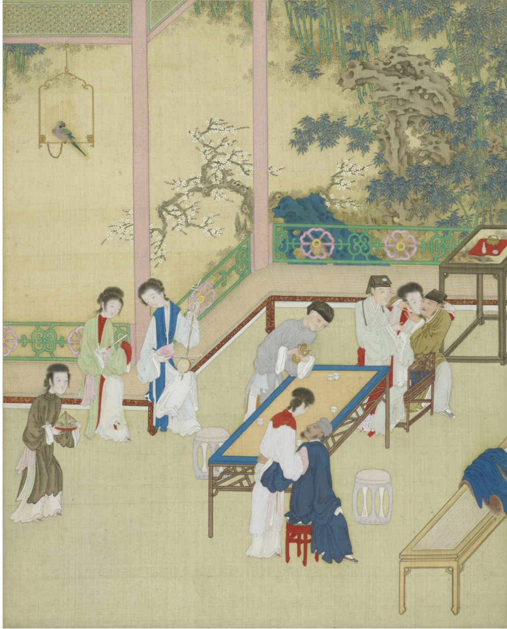
图十三 应伯爵替花邀酒