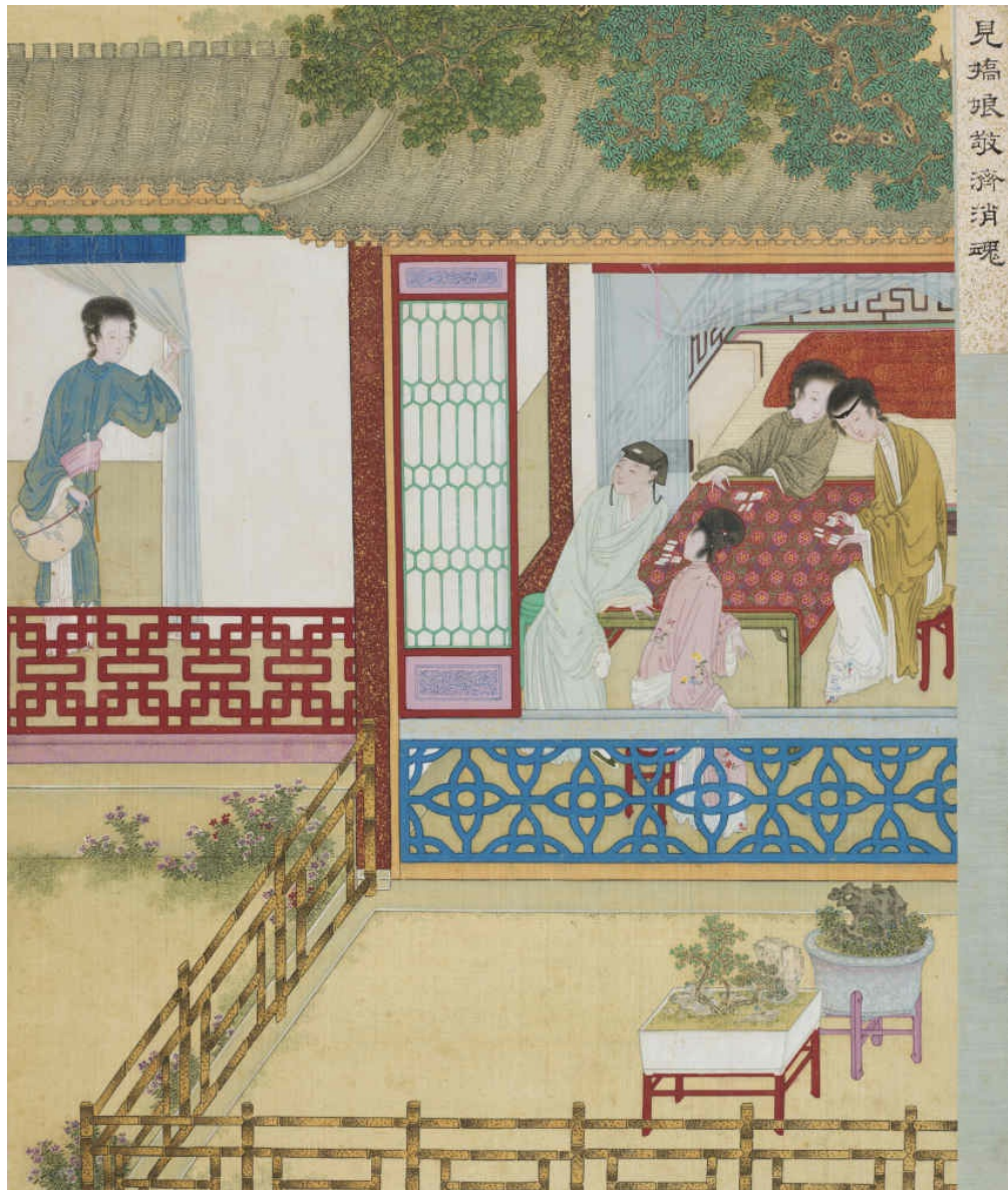
图十一 见娇娘敬济消魂