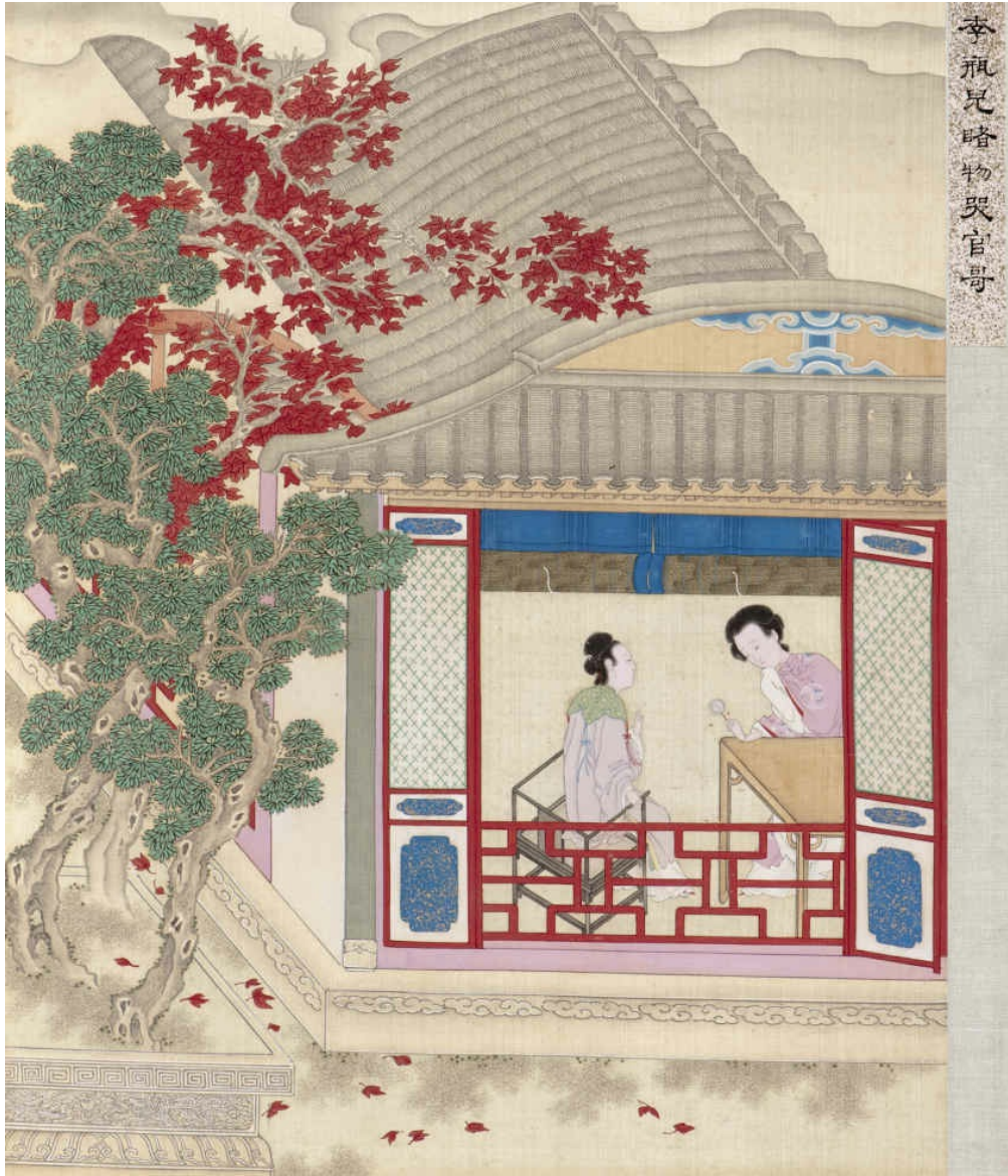
图十五 李瓶儿睹物哭官哥