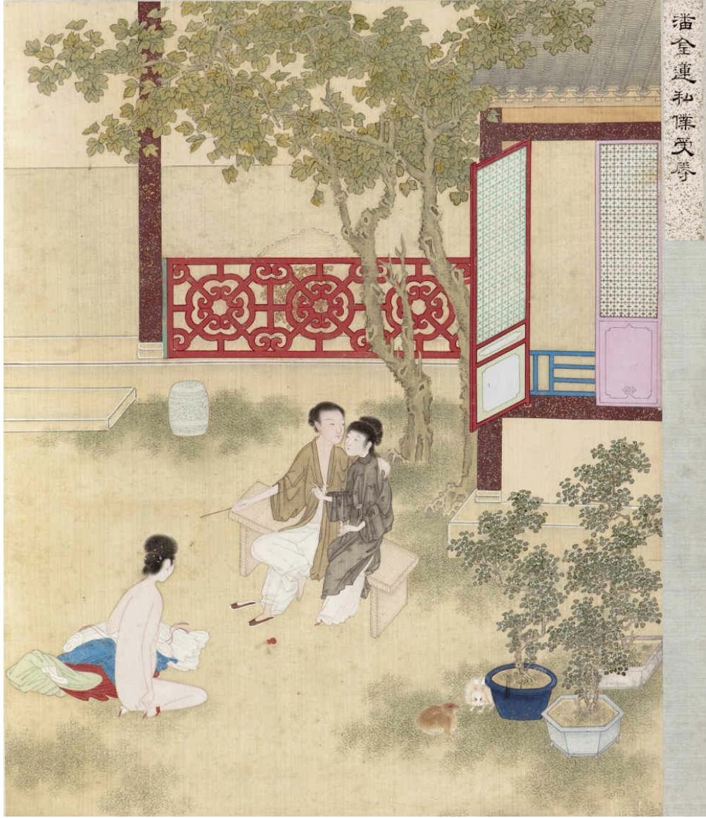
图三 潘金莲私仆受辱