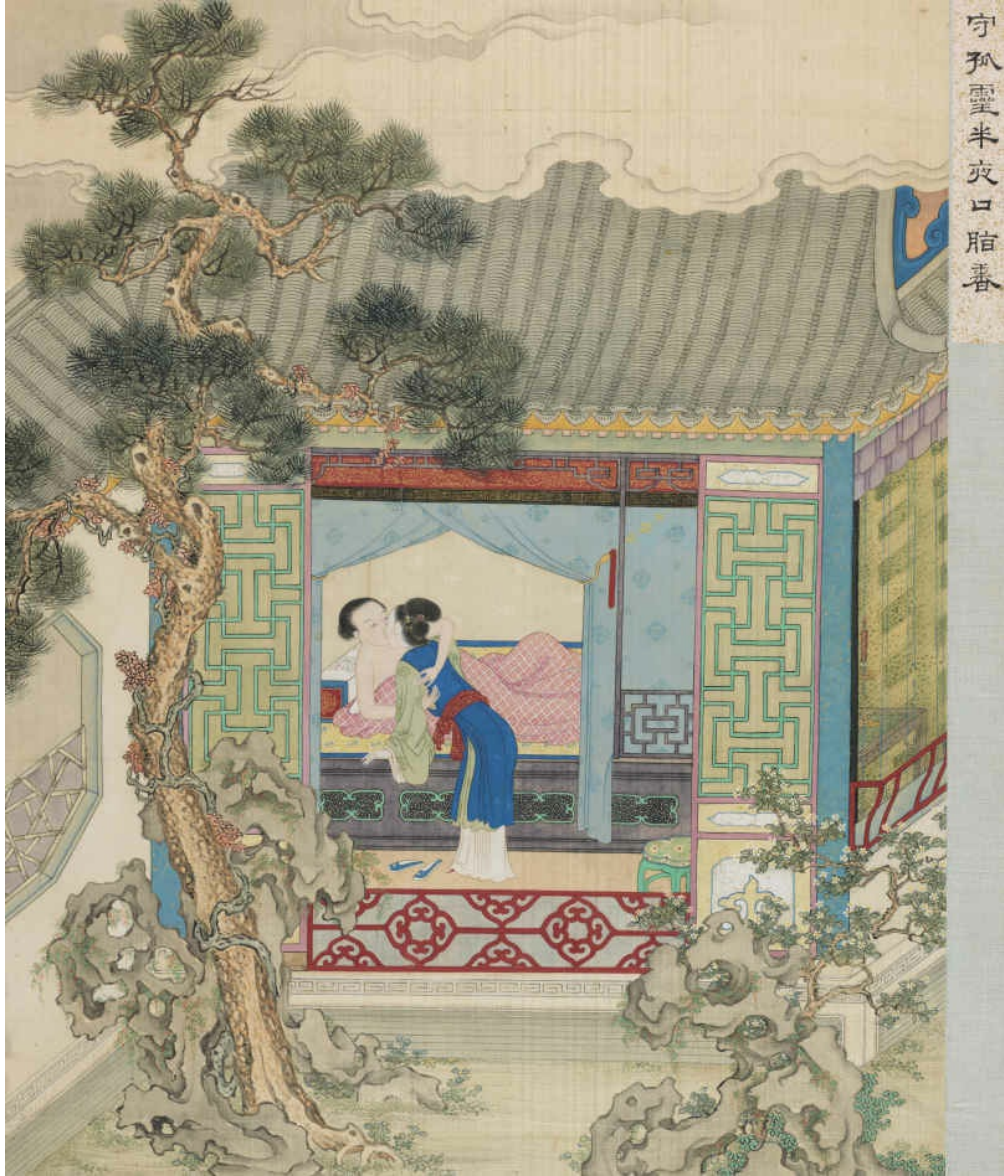
图十九 守孤灵半夜口脂香