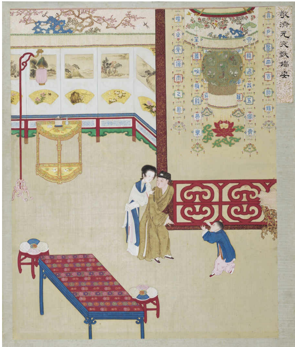
图十四 敬济元宵戏娇姿