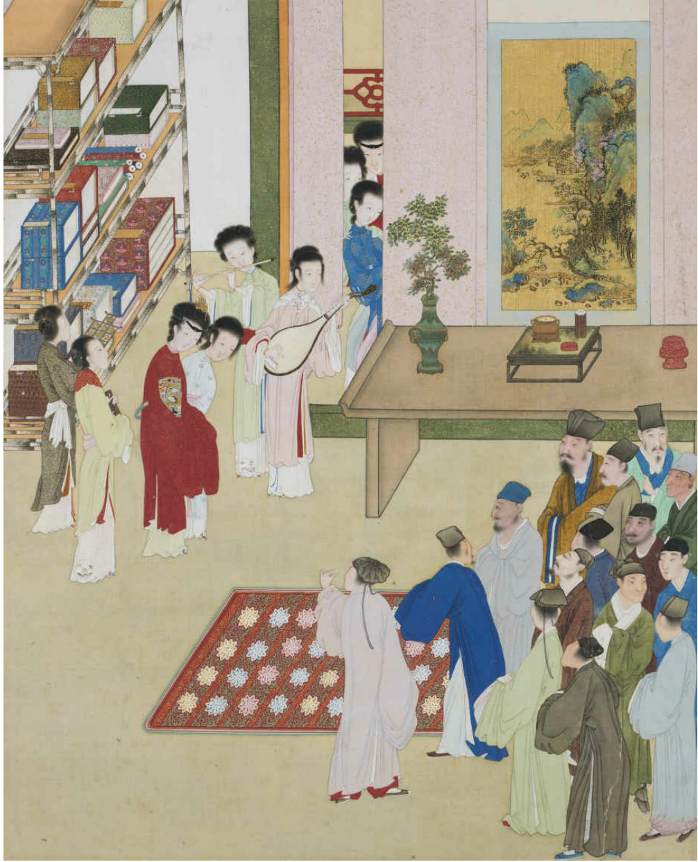
图十二 傻帮闲趋奉闹华筵