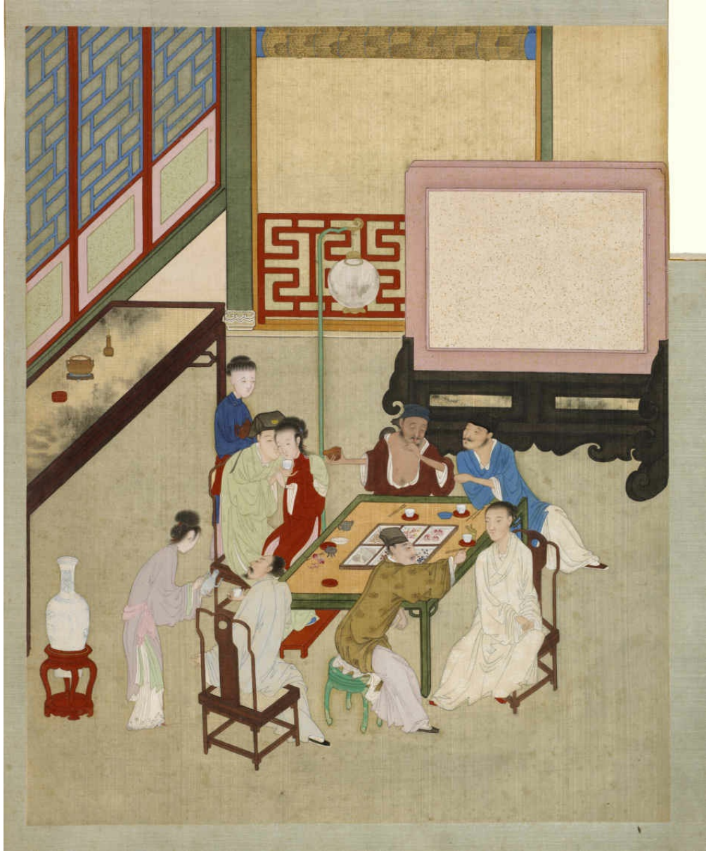
图二 西门庆梳拢李桂姐