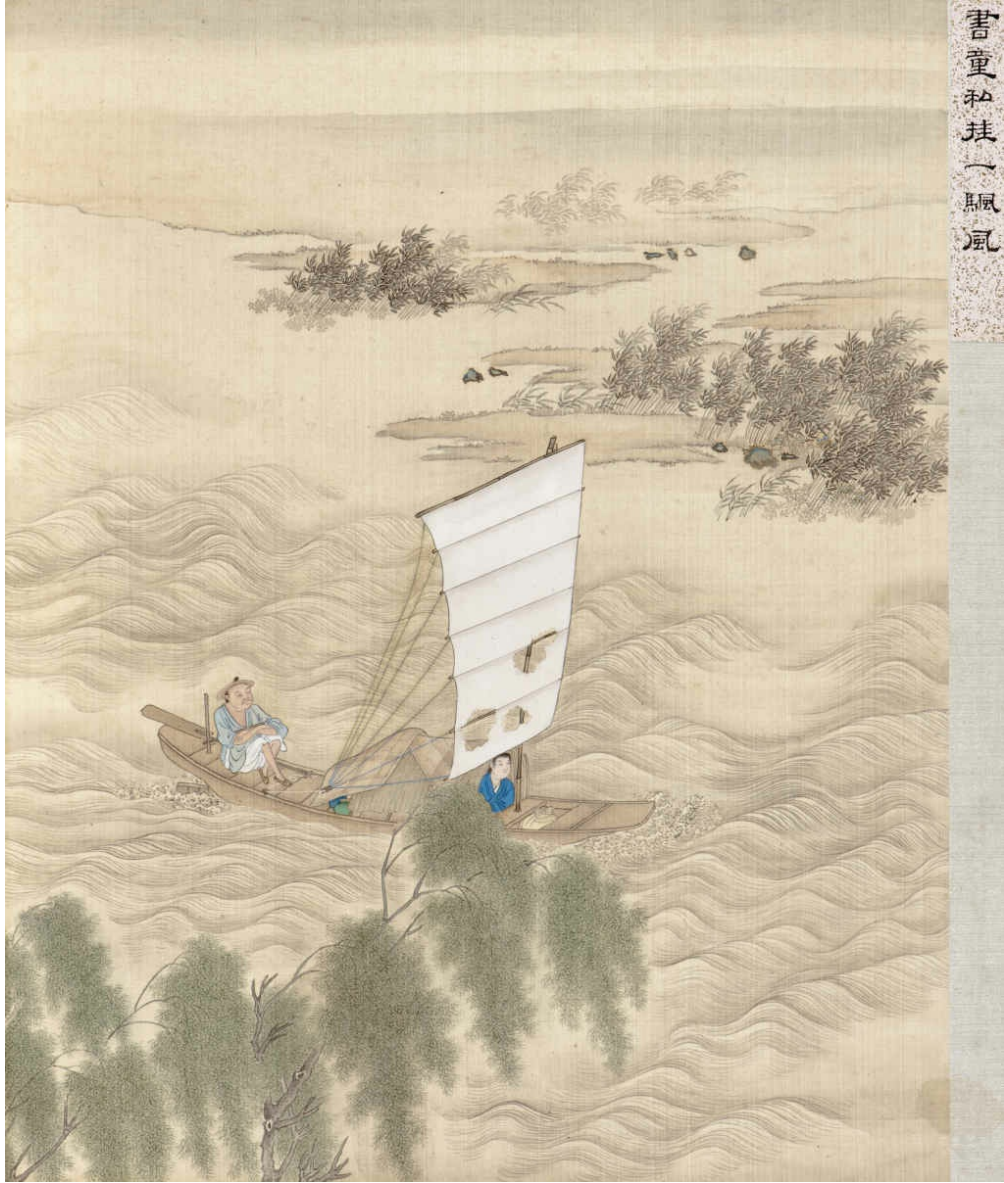
图十八 书童私挂一帆风