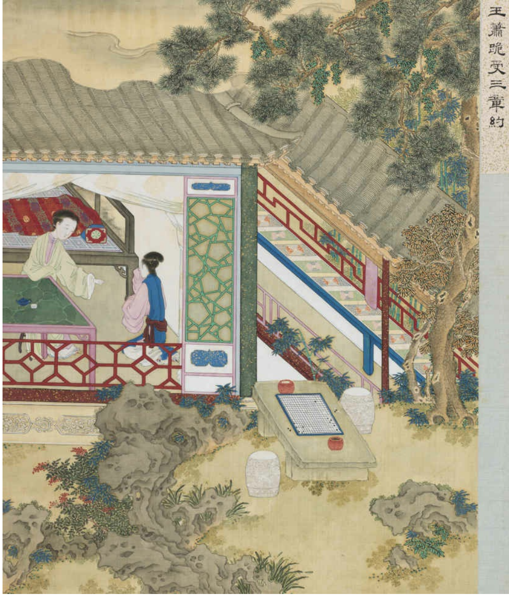
图十七 玉箫跪受三章约